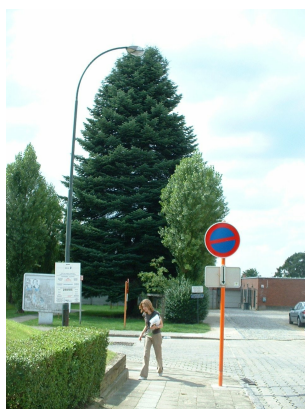
, 02 Août 2005