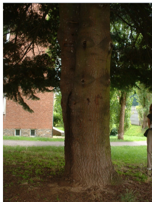
, 02 Août 2005

XLSX (Excel 2007) - XLS (Excel 1997-2003) .